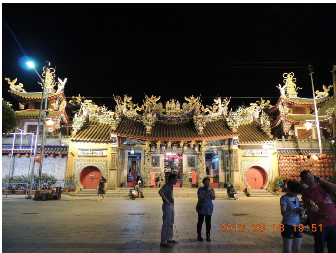
雲林西螺廣福宮 2013.8.18

廣福宮為粵東與福建人所建，從字義上解讀，「廣」在前或許當年來自粵東的客家人為數較多，故將廣字置於前。根據地方人士的敘述，現在到廣福宮參拜的客家人大多為詔安腔客家人。廣福宮採三川五門，三川殿為傳統寺廟的前殿，左、右再加上龍殿、虎殿成為五門殿，其內雕梁畫棟富含典故及隱喻，置身於此感受到先民當年辛勤開拓仍不忘本，看見這三百多年來雲林西螺的變遷，亦是人民的生活中的信仰中心，不論經過幾代，有多少的衝擊，福與禍，她依舊佇立著。