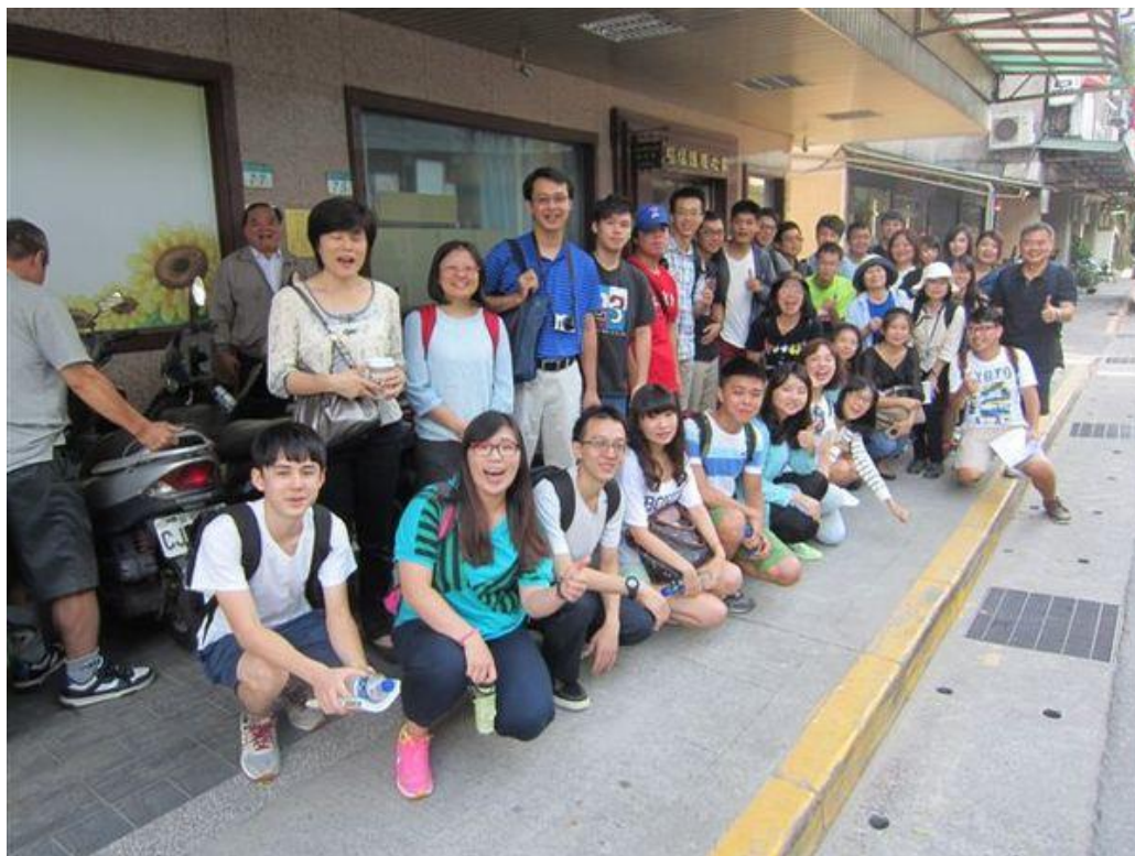
全體師生在客人會創始地合照（攝影/葉倫會 攝於 2015/09/09）

也是客家人的智慧，因為這天是天公生，廟裡殺豬公敬神，家家戶戶也準備牲禮祭拜並宴請賓客，所以一年一度客家人的「打鬥敘」，不會引起注目，「否則，當時光復前後的戒嚴社會，任何人參加非法集會，是會被砍頭的」，葉老師故意壓低嗓門，述說當年的恐怖氛圍。