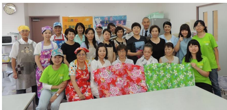
圖五與圖六：二場料理活動的圓滿完成！