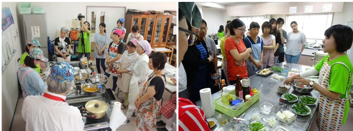
圖三與圖四：二場料理活動中的示範與講解