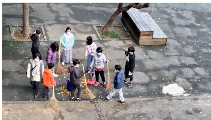
(小朋友拿竹祛把掃校園)