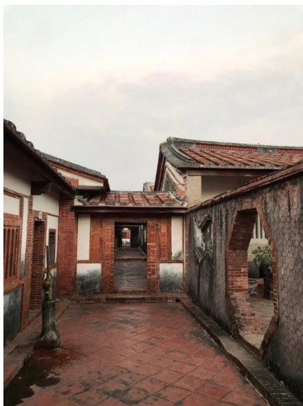
圖 3 庭院深深深幾許？斜坡下來此處有蓄洪的功能

雖然時間早已超過五點好久好久了，但蕭大哥依然相當熱情的為我們介紹，然而蕭家古厝實在太大，能說的東西實在太多了，介紹不完！故所蕭大哥在離開前還留下了他的電話，說如果我們下次再來，他依舊可以為我們免費導覽，真的非常非常感謝蕭大哥！（未完待續……）