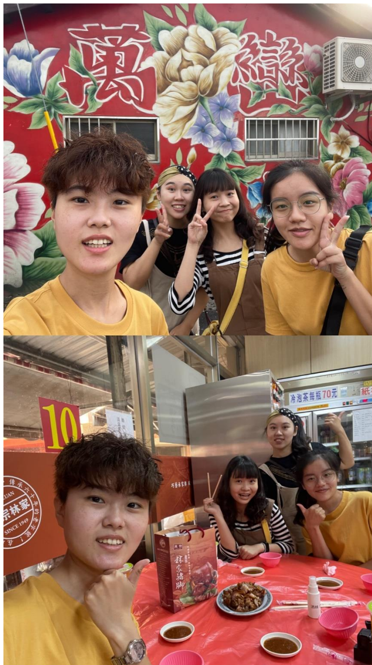
圖 2 「萬巒我來了」彩繪牆（上）、林家豬腳食飯（下）

接著，我們來到了「先鋒堆—萬巒」，旅途中品嚐美食填飽肚子也是必要的，說到萬巒怎麼可以不來吃鼎鼎大名的「萬巒豬腳」呢？豬腳一條街，每個人心中都有各自的愛店，我們家都吃林家豬腳，不曉得大家家裡都吃哪一家呢？