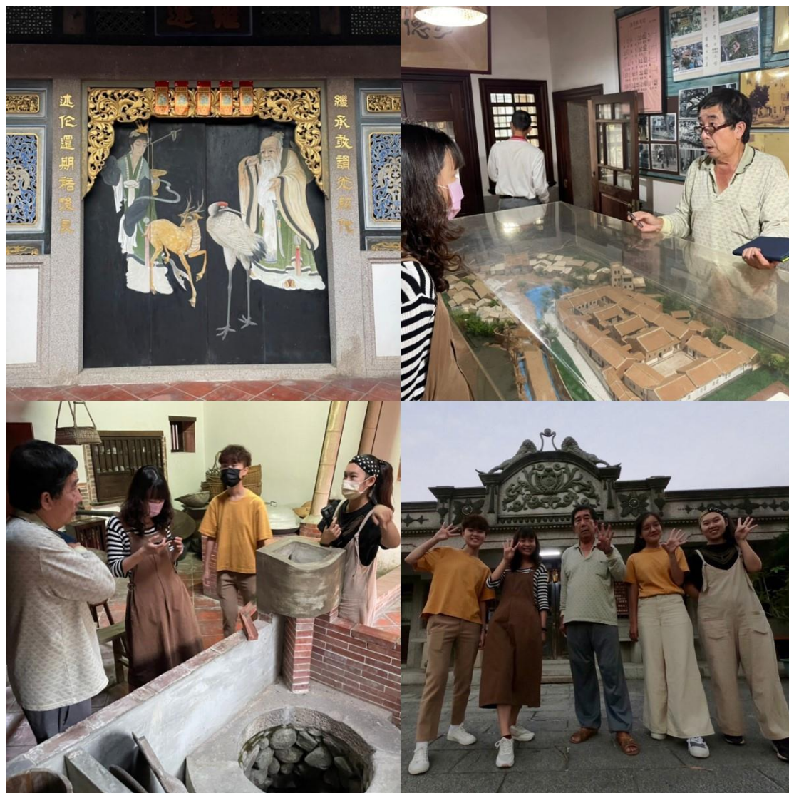
圖 4 「仙翁」與「仙姑」門板象徵「祿壽雙全」(左上)、蕭大哥向我們介紹蕭家古厝整體建築(右上)、蕭大哥向我們介紹蕭家廚房取水上的智慧(左下)、與蕭大哥合影留念(右下)