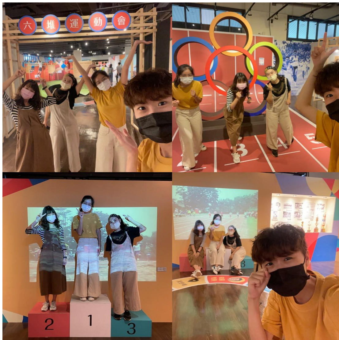
圖 1 客家碩六堆運動會

結束園區的行程後，我們繼續往南，經過「中堆－竹田」的「六堆忠義亭」，該地曾名「六堆忠義祠」，至 2015 年才由時任總統馬英九揭牌正名，六堆忠義亭係經康熙皇帝授意下所興建，為表彰六堆先民在朱一貴事件中的忠義精神，特賜匾額一塊，供奉「皇上萬歲聖旨牌」，同時也祭祀那些在事件中英勇犧牲的義民。