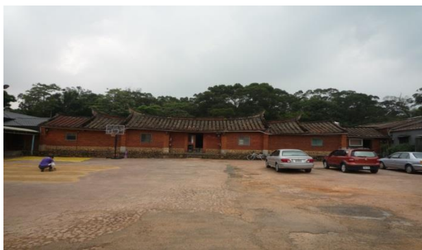
圖 1 楊梅高山頂鄭屋前堂九開間，屋前闊闊个禾埕、半月池。（2014.07.29 攝）